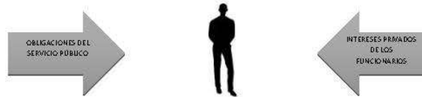
Figura 1. Conflicto de Interés

Cabe mencionar que la OCDE cuando se refiere a "conflicto de interés" su definición se apega al tipo "real," es decir, "un conflicto entre el deber público y los intereses privados de un funcionario público, en el que el administrativo o empleado tiene intereses personales que pueden influir de manera indebida en el desempeño de sus deberes y responsabilidades oficiales"