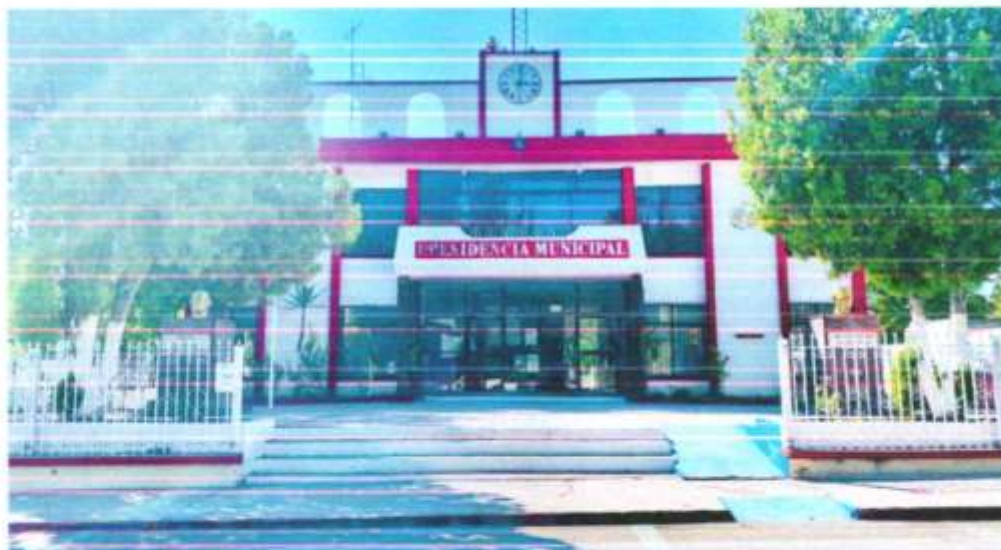
Presidencia Municipal de Ocampo, Coahuila