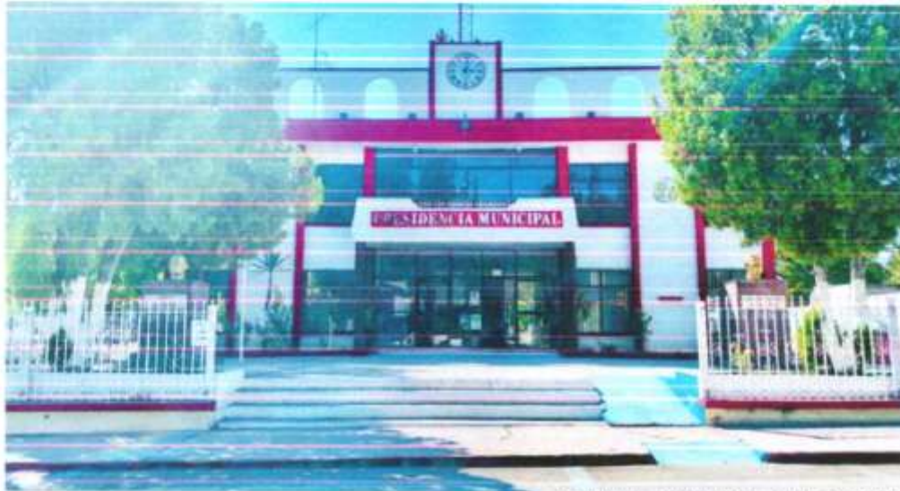
Presidencia Municipal de Ocampo, Coahuila