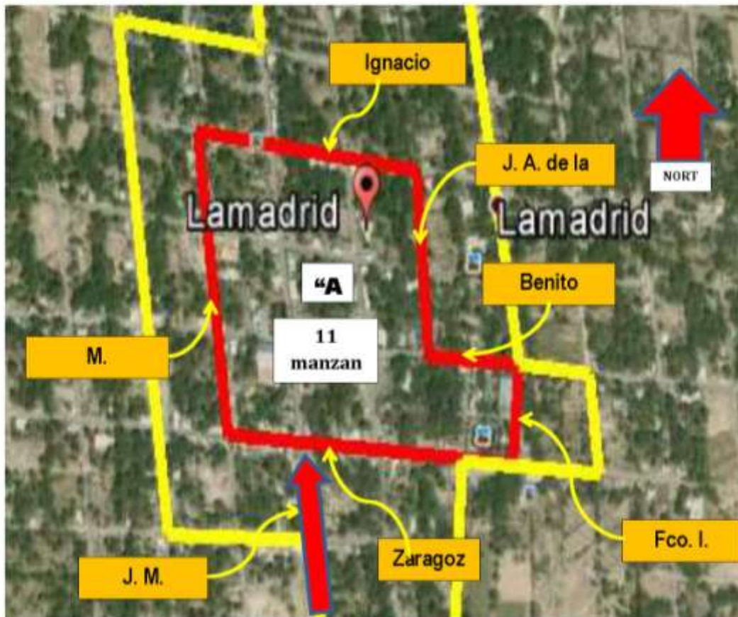
CENTRO HISTÓRICO DE LA VILLA DE LAMADRID PERÍMETRO NUCLEAR "A"

Las calles perimetrales que comprenden esta área de protección incluyen las dos aceras.